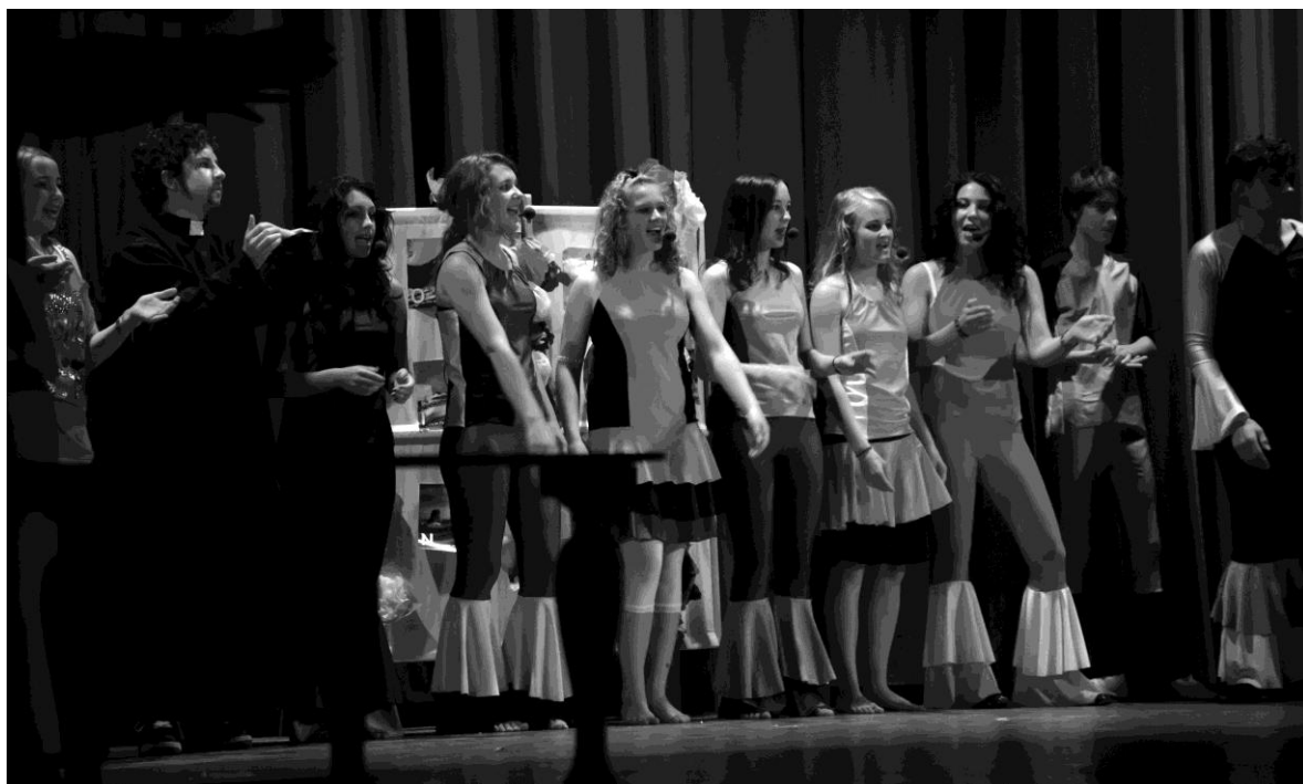
Impression vom Musical Mamma Mia der 9. Klassen Sommer 2010